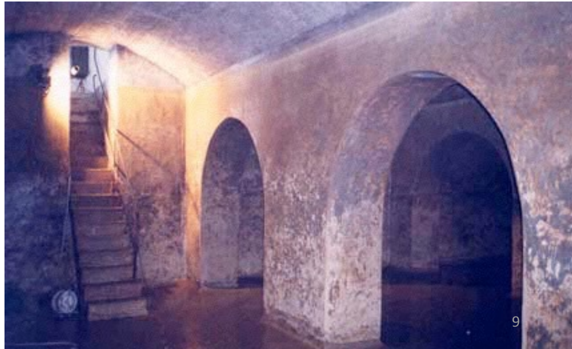
réservoir d'eau à Neuchâtel